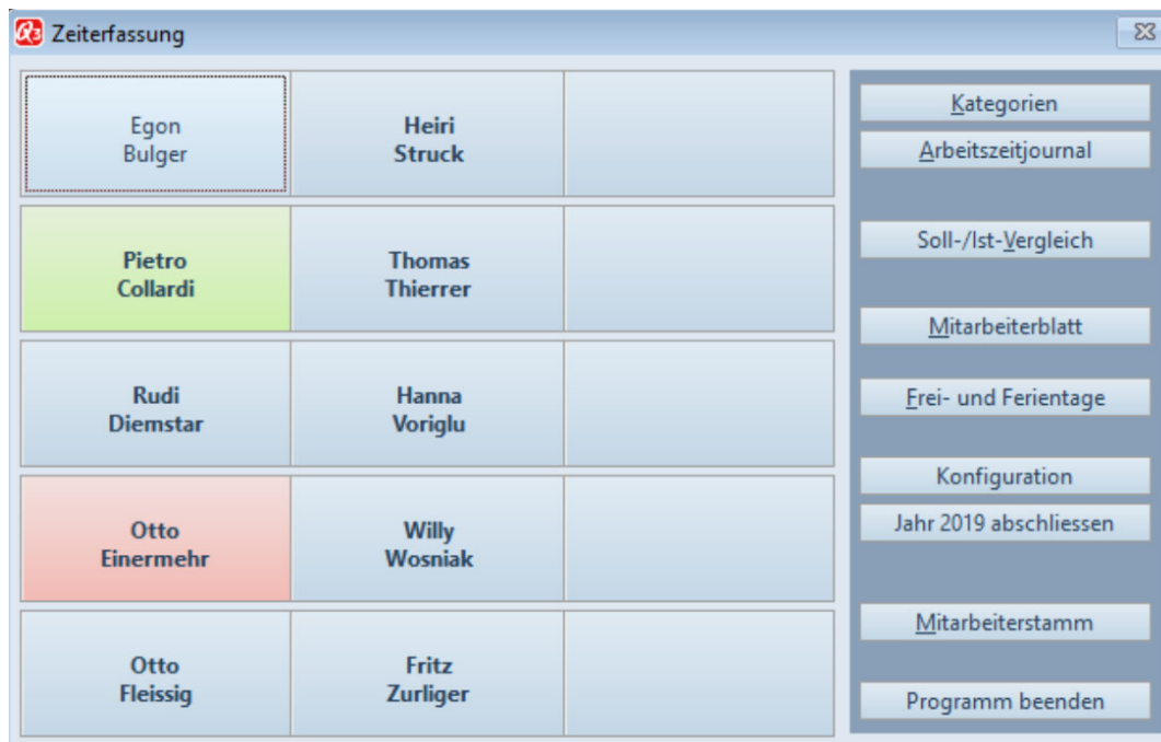
Zeiterfassungsfenster im Administratormodus

Das Fenster zeigt alle Mitarbeiter, welche für die Zeiterfassung aktiv sind. Zudem sind alle Funktion rund um die Zeiterfassung von diesem Fenster aus zugänglich.